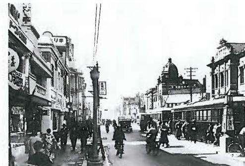
13. 市電米町停車場(1939年頃)名古屋市広報課蔵

昭和9年(1934)名古屋市の人口は100万人を突破した。それにあわせて名古屋市内の詳細な住宅地図が刊行された。映像塾蔵(デジタルリマスター)