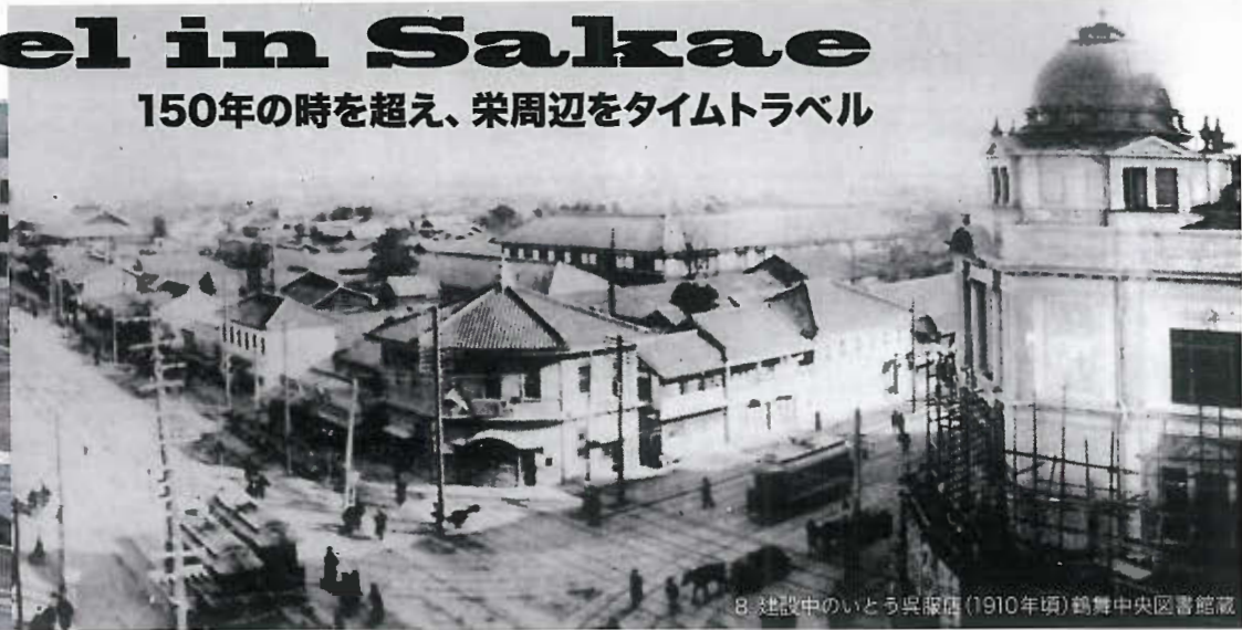
8. 建設中のいとう呉服店(1910年頃)