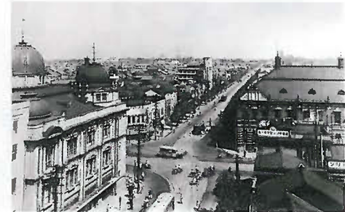
12. 栄町交差点(1936年頃)