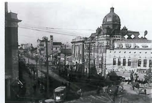
10. 栄町交差点(1926年頃)名古屋市政資料館蔵