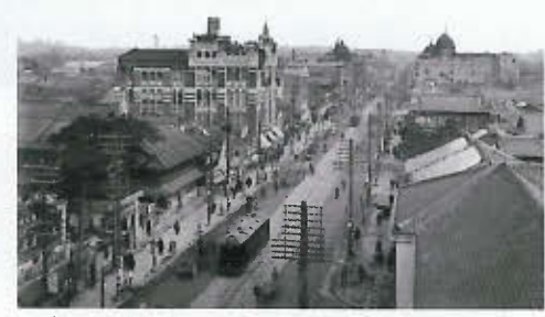
11. 十一屋百貨店付近の広小路(1926年頃)